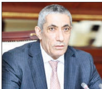
Azərbaycan Prezidenti öz siyasətində daim humanizm prinsipini rəhbər tutur

Vəcib bir məqama xüsusi diqqət yetirmək lazımdır. Belə ki, Azərbaycan müstəqilliyini bərpa etdiyi 18 oktyabr 1991-ci ildən Ümummilli Lider Heydər Əliyevin hakimiyyətə gəldiyi dövrə qədər ölkəmizdə amnistiya və ya əfv haqqında hər hansı bir qərar və sərəncam olmayıb. Müstəqil respublikamızda 1996-cı ildən başlayaraq əfv sərəncamları imzalanıb, amnistiya haqqında qərarlar qəbul olunub.