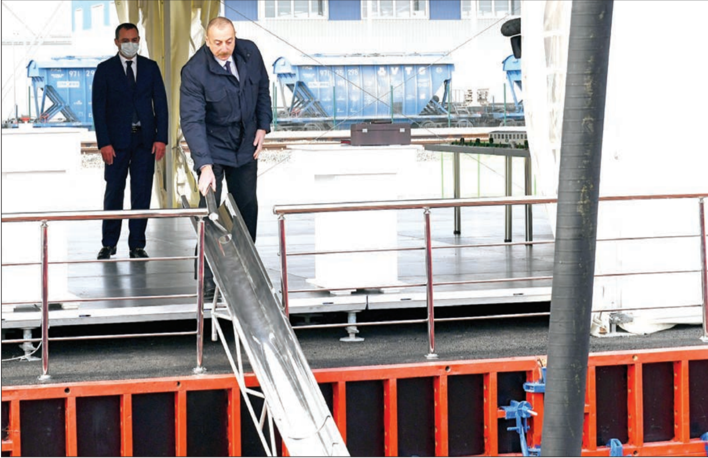
Əvvəli 1-ci sah.

Təməlini qoyduğunuz və eyni zamanda, hazırda məhsul istehsalına başlayan müəssisələrin növbəti mərhələlərdə qeyri-neft sənayesinin şaxələndirilməsi fonunda töhfəsini necə qiymətləndirirsiniz?