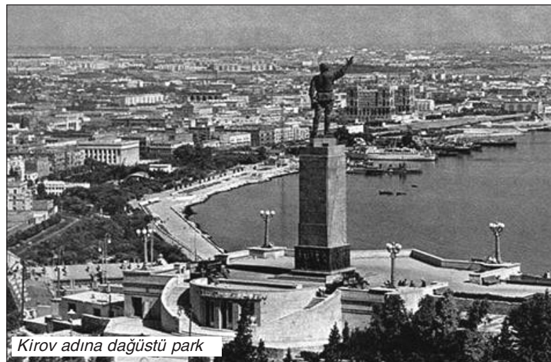
Kirov adına dağüstü park