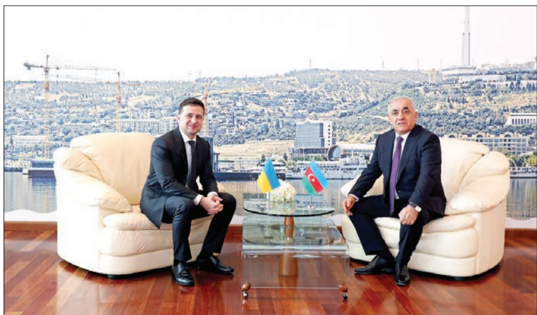
Azərbaycan Respublikasının Baş Naziri Əli Əsədov və ölkəmizdə rəsmi səfərdə olan Ukrayna Prezidenti Vladimir Zelenski dekabrın 17-də birgə işçi nahar ediblər.