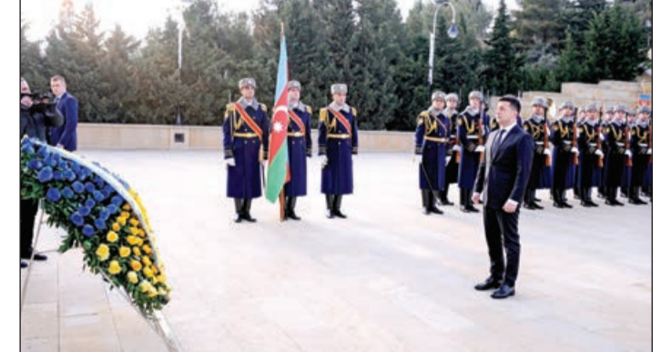
Ukrayna Prezidenti Vladimir Zelenski dekabrın 17-də Şəhidlər xiyabanını ziyarət edib. AZƏRTAC xəbər verir ki, burada Ukrayna Prezidentinin şərafinə fəxri qarovul dəstəsi düzülüb. Prezident Vladimir Zelenski Azərbaycanın müstəqilliyi və ərazi bütövlüyü uğrunda mübarizədə canlarından keçmiş qəhrəman vətən övladlarının məzarlarını ziyarət edib, "Əbədi məşəl" abidəsinin önünə ekilil qoyub. Müdafiə Nazirliyinin əlahiddə nümunəvi orkestrinin ifasında Ukraynanın və Azərbaycanın Dövlət himnləri səsləndirilib. Bakının ən hündür nöqtəsindən Azərbaycan paytaxtının mənzərəsini seyr edən ali qonaq Şəhidlər xiyabanının tarixi və şəhərdə görülən abadlıq-quruculuq işləri barədə məlumat verilib.