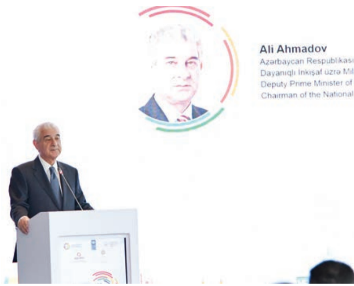
Ali Ahmadov Azərbaycan Respublikası B Dayanıqlı İnkişaf üzrə Milli Deputy Prime Minister of the Chairman of the National C