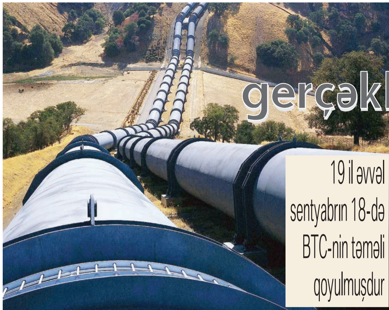
Əvvəli 1-ci sah.

Qeyd edək ki, COVID-19 pandemiyasının təsiri nəticəsində Azərbaycan neftinin bir barelinin qiyməti 2020-ci ilin aprelin 21-də 15,81 dollara enmişdi. Sonradan global miqyasda vaksinasiya prosesi və effektiv karantin tədbirləri nəticəsində neft tələbatı tədricən bərpa olunmağa, qiymətlər artmağa başlayıb. “Azeri Light”ın son iki ildə maksimum qiyməti bu il iyulun 5-də qeydə alınıb: bir barrel üçün 78,35 dollar.