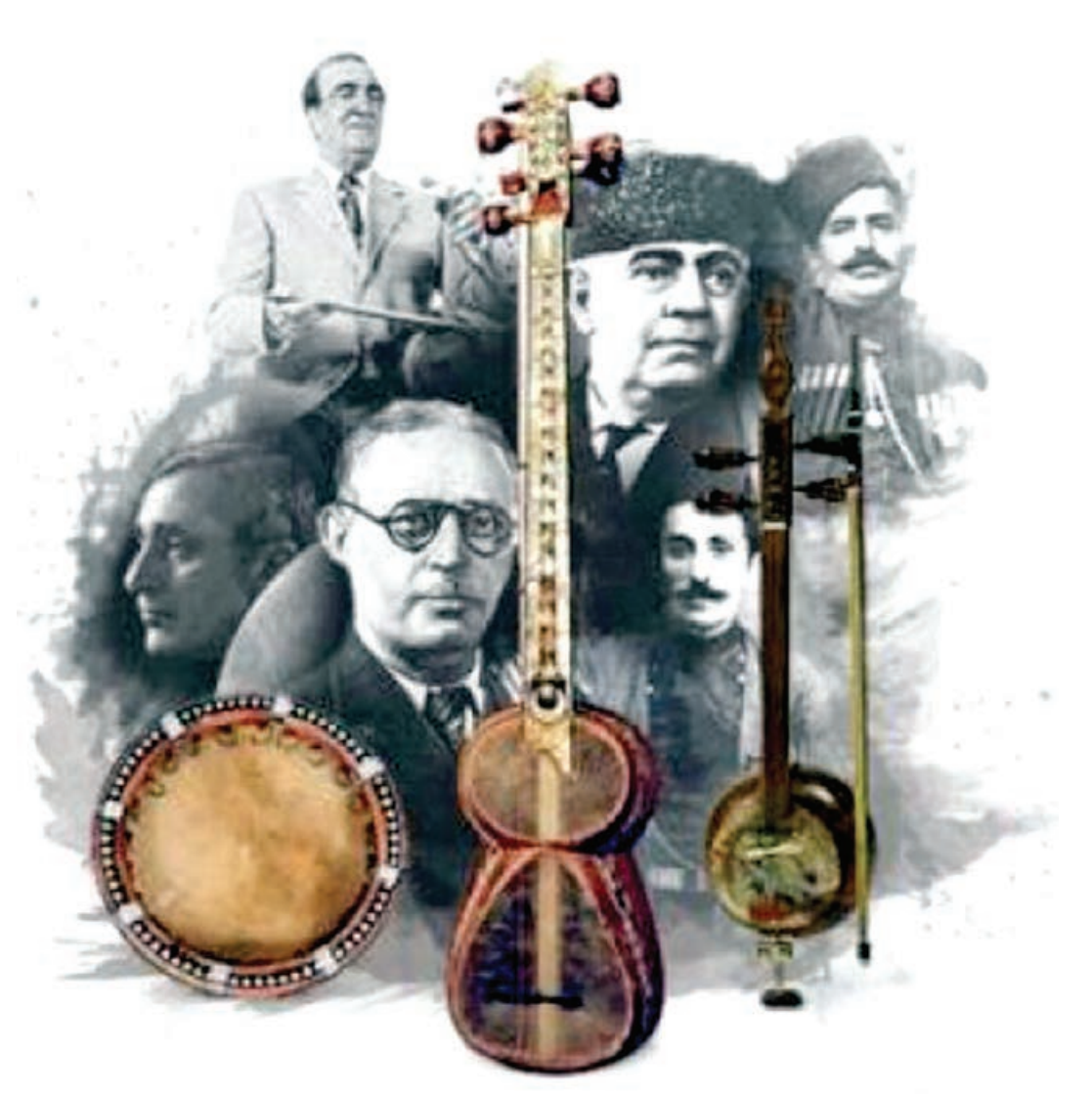
Əvvəlki 1-ci səh.

18 sentyabr - Üzeyir bəyin doğum gündür. Bu gün xalqımız üçün böyük bayramdır. 1995-ci ildən Ulu Öndər Heydər Əliyevin inzaladığı sərəncama əsasən, 18 Sentyabr Milli Musiqi Günü kimi qeyd edilir. Bu gün xalqımız Üzeyir Hacıbəyli zirvəsinə bir daha sevgi və minnətdarlıqla baxır.