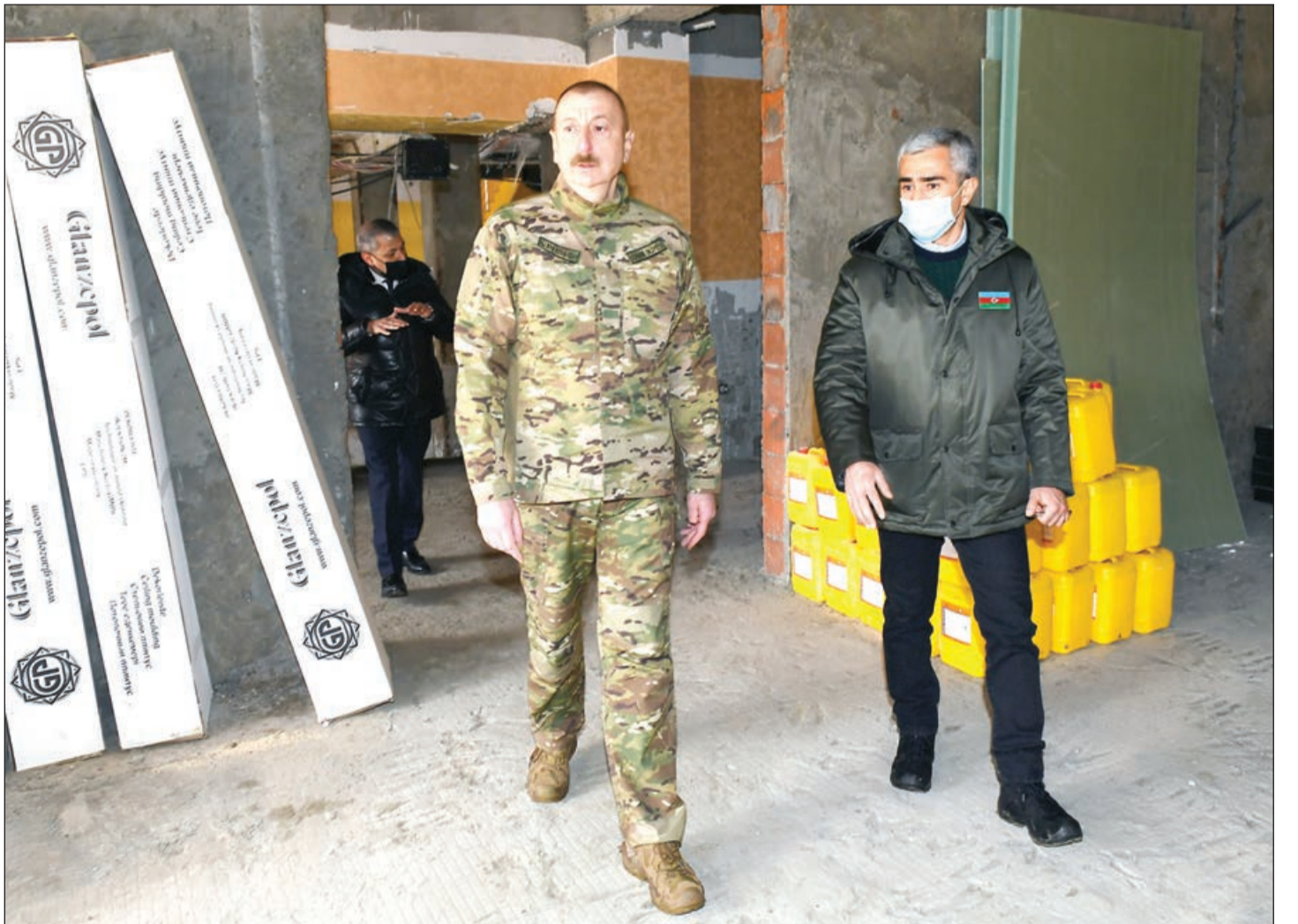
Ardı 4-cü səh.