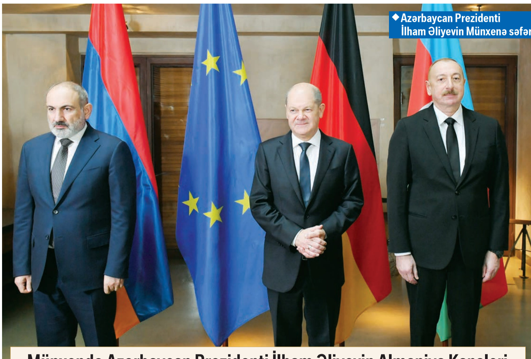
◆ Azərbaycan Prezidenti İlham Əliyevin Münxenə səfəri