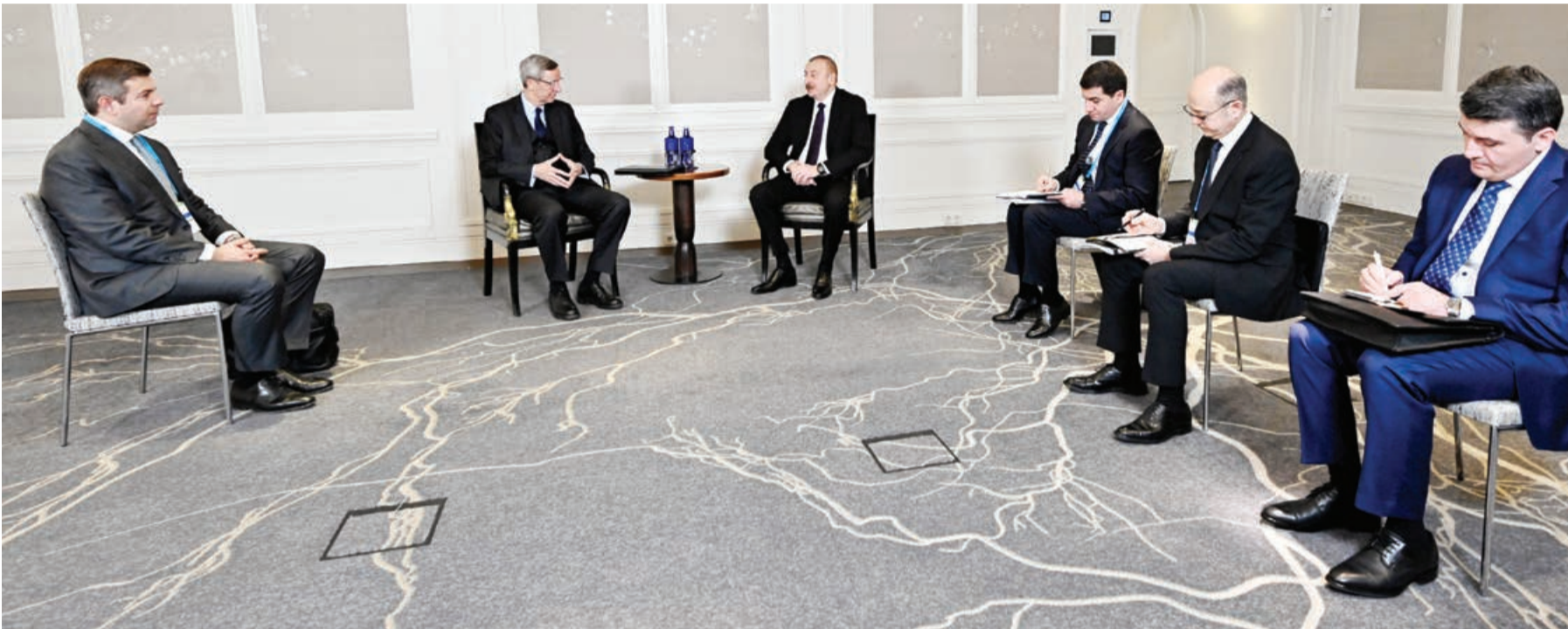
Əvvəli 1-ci sah.