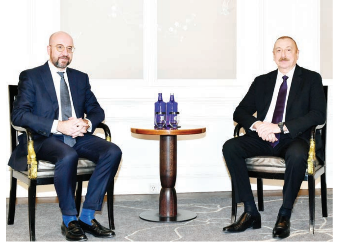
Əvvəli 1-ci sah.

AZƏRTAC xəbər verir ki, görüşdə Azərbaycanla Ermənistan arasında münasibətlərin normallaşdırılması, sülh müqaviləsi üzrə danışıqların Brüssel sülh prosesi ətrafında müzakirələr aparıldı.