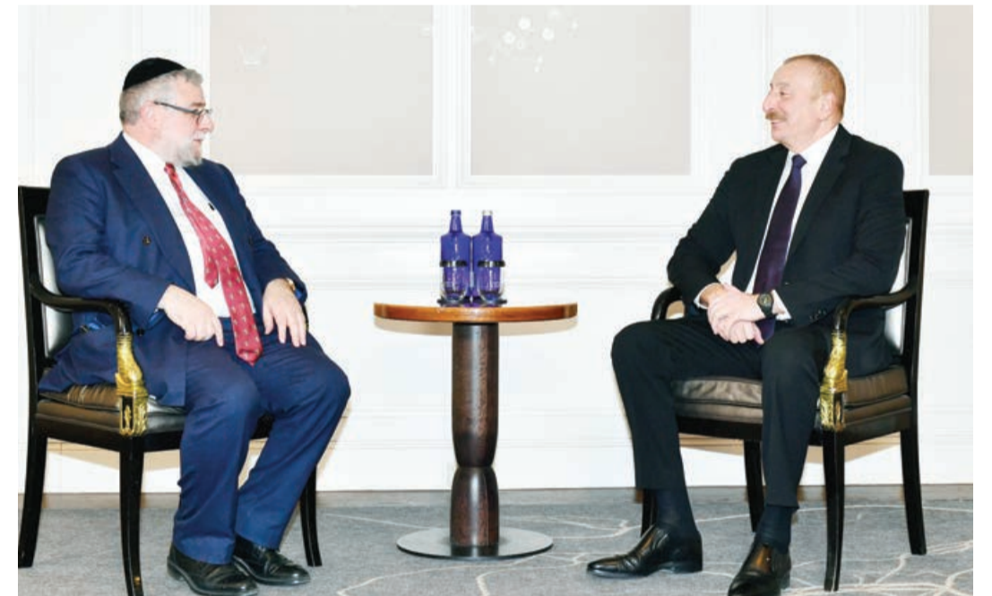
Əvvəli 1-ci sah.

AZƏRTAC xəbər verir ki, görüşdə dövlətimizin başçısı tarixən yəhudi icmasının Azərbaycanda dostluq, mehribanlıq və qarşılıqlı anlaşma mühitində yaşadığını, dini ibadətini sərbəst yerinə yetirdiyini, sınaqoqların fəaliyyəti üçün şəraitin yaradıldığını qeyd etdi.