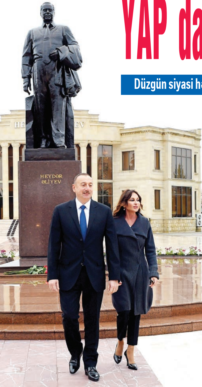
Əvvəlki 1-ci səh.

Düzgün siyasi hədəflər, xalqın maraqlarını əks etdirən fəaliyyət və Azərbaycan amalı partiyamızın davamlı nailiyyətlərinin əsas təməlidir