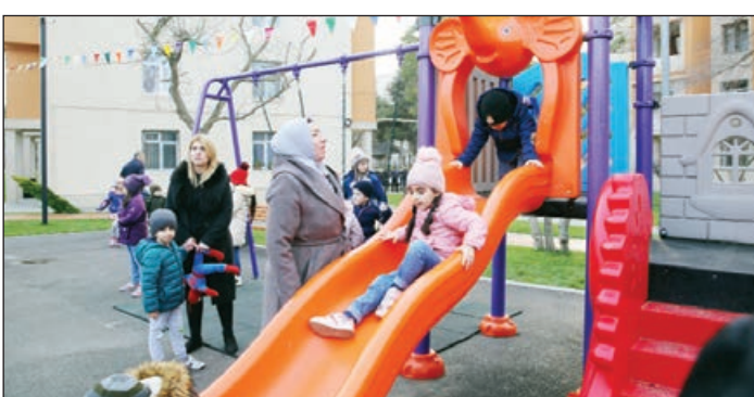
əkilib, 9 min kvadratmetr ərazidə yaşılıq zolağı salınıb. Həmçinin sakinlərin təhlükəsizliyinin təmin edilməsi məqsədilə ərazidə müşahidə kameraları və yanğın hidrantları quraşdırılıb.

Sözünə gələndə layihənin Bakının bütün rayonlarında həyata keçirilməsi nəzərdə tutulur. Bununla əlaqədar, paytaxtımızın abadlaşdırılmaya ehtiyacı olan həyətləri haqqında məlumat və tövsiyələri IDEA İctimai Birliyinə təqdim edilməsi xahiş olunur.