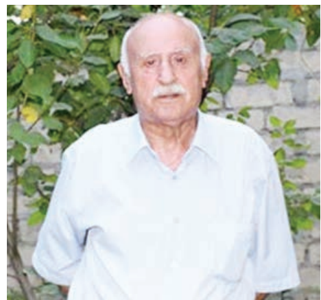
Əməkdar artist Məcnun Hacıbəyov Quba rayonunun İkinci Nügədi kənd qəbiristanlığında dəfn olunub.

COVID-19 testinin nəticəsi uçuşdan əvvəl 72 saat ərzində etibarlı olmalıdır.