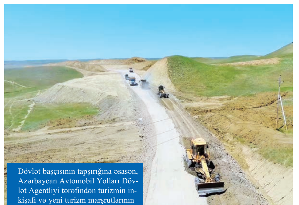
Dövlət başçısının tapşırığına əsasən, Azərbaycan Avtomobil Yolları Dövlət Agentliyi tərəfindən turizm inkişafı və yeni turizm marşrutlarının yaranmasına gətirib çıxaracaq yol infrastrukturunu layihələrinin icrasına həyata keçirilib.

Layihə "Build Your Future" MMC tərəfindən yerinə yetirilib.