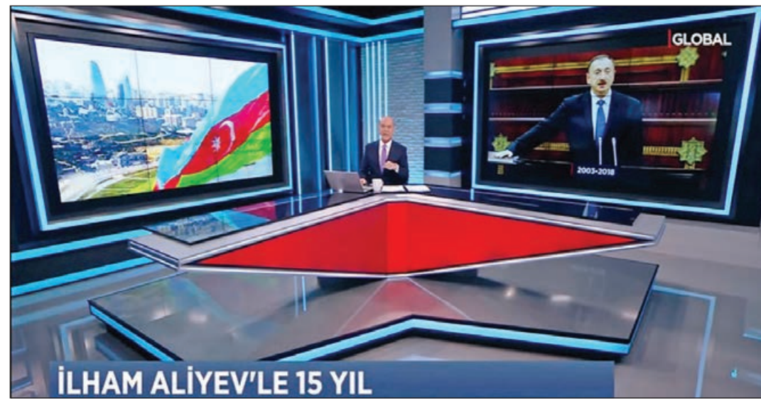
İLHAM ALİYEV'LE 15 YIL

Türkiyənin “Haber Global” telekanalında Azərbaycan Respublikasının Prezidenti İlham Əliyevin ölkə rəhbəri vəzifəsində 15 illik fəaliyyəti dövründə əldə olunan nailiyyətlərə həsr edilən geniş süjet yayımlanıb.