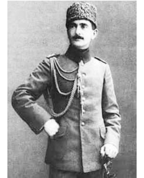
Həzin bir xatirə

O, İstanbula qayıdır. Təqiblərə məruz qalan cəsur komandan orada hərbi nəzarət polisi tərəfindən həbs olunub ingilislərə təhvil verilir. Nuru paşa İstanbuldan Batum həbsxanasına gətirilir. İngilislər onlara qarşı vuruşduğuna və Azərbaycanda göstərdiyi hərbi şücaətə görə Nuru paşa barəsində edam qərarı çıxarırlar. Azərbaycan milli azadlıq hərəkatının