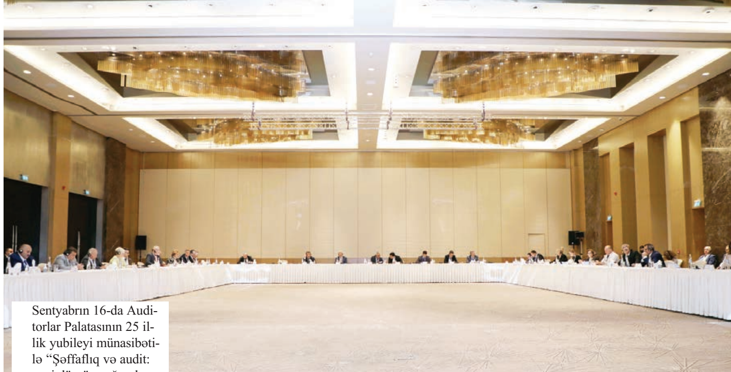
Sentyabrın 16-da Auditorlar Palatasının 25 illik yubileyi münasibətilə “Şəffaflıq və audit: yeni dövrün çağırışları, problemlər, vəzifələr” mövzusunda beynəlxalq elmi-praktik konfrans keçirilib.

Konfransda 12 ölkənin (Azərbaycan, Avstriya, Belçika, Türkiyə, Özbəkistan, Rusiya Federasiyası, Latviya, Polşa, Gürcüstan, Ukrayna, Makedoniya, Çernoqoriya) müvafiq audit və mühasibatlıq qurumlarını, beynəlxalq peşəkar təşkilatları, ölkəmizin dövlət və qeyri-hökumət təşkilatlarını, özəl sektorunu, ali təhsil və elmi-tədqiqat institutlarını təmsil edən 30-dan çox qurumdan 60-a yaxın nümayəndə iştirak edib.