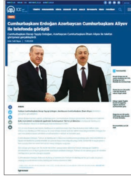
Cumhurbaşkanı Erdoğan Azərbaycan Cumhurbaşkanı Əliyev ilə telefonla görüşdü.