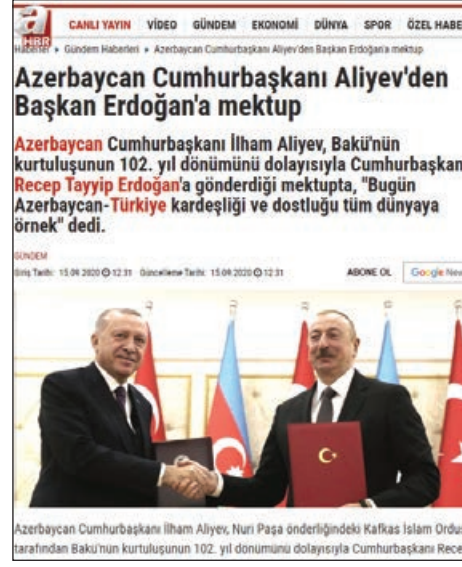
Azərbaycan Cumhurbaşkanı İlham Əliyev, Nuri Paşa andirindəki Kafkas İslam Ordusu tərəfindən Bakı'nın kurtuluşunun 102. il dönmünü dolayısıyla Cumhurbaşkanı Recep Tayyip Erdoğan'a göndərdiyi məkupta, "Bugün Azərbaycan-Türkiyə kardeşliyi ve dostluğu tüm dünyaya örnek" dedi.

AZƏRTAC xəbər verir ki, Türkiyə-Azərbaycan münasibətlərinin qar-