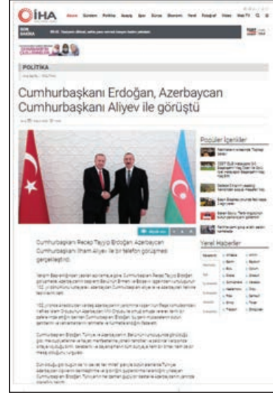
Cumhurbaşkanı Erdoğan, Azərbaycan Cumhurbaşkanı Əliyev ilə görüşdü.

deşlik nümunəsi və örnək kimi təqdim edilmiş məqalələr və reportajlar "Anadolı", İHA, DHA agentlikləri, TRT HABER, A HABER, NTV televiziya kanalları, eləcə də "Star", "Yeni çağ", "Yeni səfaq", "Milliyet" və digər qəzetlər tərəfindən yayılıb.