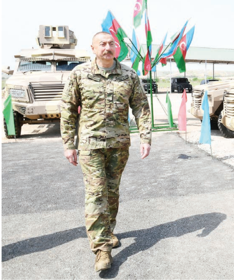
Mina xəritələrinin dəqiqliyi cəmi yüzdə iyirmi beş faizdir

Bizim burada əsas rəqibimiz zəmandır. Çünki Qarabağın və Şərqi Zəngəzurun bərpası üçün kifayət qədər maliyyə vəsaiti toplanıb və səfərbər olunub. Amma bizim əsas rəqibimiz zəmandır və hər kəs anlamalıdır ki, burada da zamana ehtiyac var. Lakin biz vətəndaşlarımızı ən qısa müddət ərzində qaytaracağıq".