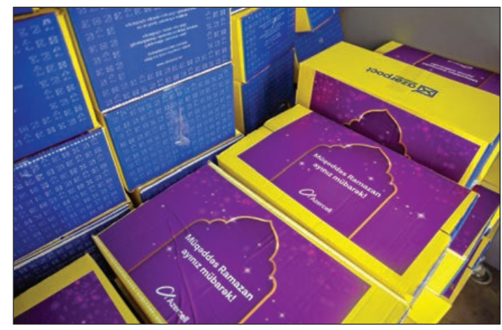
"Azercell" şirkətinin təşkil etdiyi yardım aksiyaları COVID-19 pandemiyası ilə əlaqədar xüsusi karantin rejiminin tətbiq olunduğu dövrdə həssas təbəqədən olan insanların sosial rifahını yüksəltmək, dövlət tərəfindən həyata keçirilən tədbirlərə dəstək vermək məqsədi daşıyır.

"Azercell Telekom" MMC koronavirus (COVID-19) pandemiyası ilə əlaqədar karantin dövründə xüsusi diqqət və qayğıya ehtiyacı olan insanlara, aztəminatlı ailələrə dəstəyini davam etdirir. Ötən iki həftədə olduğu kimi, müqəddəs Ramazan ayının üçüncü həftəsində də bölgələrdə sosial təcrid şəraitində yaşayan həssas kateqoriyalardan olan daha 1000 ailəyə ərzaq məhsullarından ibarət sovqat paylanıb.