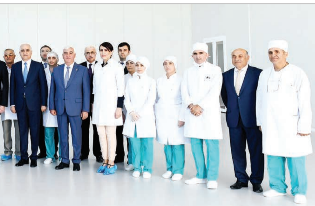
görürük və əminəm ki, dina- mik inkişafımız bundan son-