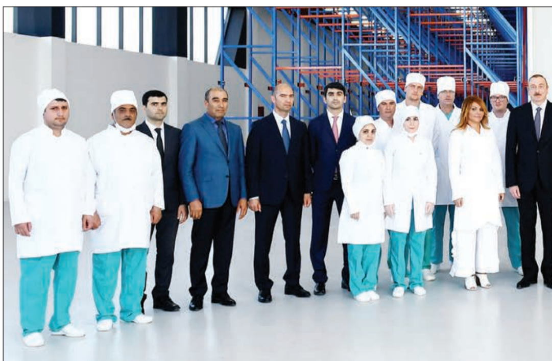
mühiti, sərmayə iqlimi var. Belə olmasaydı, xarici şirkət-