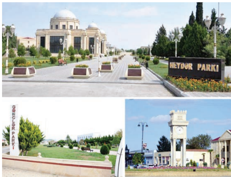
Ümumilikdə Goranboy şəhərinin abadlaşdırılması, küçə və meydanların yenidən qurulması, çoxmənzilli yaşayış

Yazın gəlişi ilə küçələrin abadlaşdırılması və yaşillığın salınması daha da genişləndirilmişdir. İndi rayon mərkəzində elə bir küçə tapmaq olmaz ki, orada yenidənqurma işləri aparılmasın. Hazırda şəhərin Nizami küçəsində əsaslı tikinti-quruculuq və abadlıq işləri aparılır. Küçəyə səki daşları və bardürlər düzülür, gəcə işıqlandırmasını təmin etmək üçün dayaqlar qurulur, asfalt döşəməsinə hazırlıq işləri görülür. Rayon rəhbərliyi tez-tez abadlıq işləri aparın inşaatçıların yanında olur, işlərin keyfiyyətli aparılması və digər küçələrdə görülən işlərdə tutulan işlərlə bağlı tapşırıq və tövsiyələrini verir.