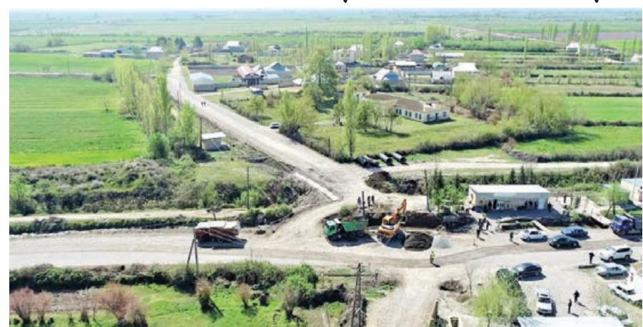
Azərbaycan Avtomobil Yolları Dövlət Agentliyi tərəfindən Bərdə rayonunda Qarağacı-Mirzəçöhrli-Mollağullar avtomobil yolunun yenidən qurulmasına başlanılıb.

Respublika əhəmiyyətli Mingəçevir-Bəhrəmtəpə avtomobil yolunun 46-cı km-dən ayrılın yolunun uzunluğu 8 km olmaqla IV texniki dərəcəyə uyğun yenidən qurulur.