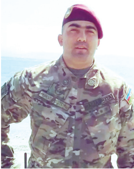
məktəbin heyətində qoyulacağını bildirdi. Həmçinin qeyd edib ki, Xırdalanda qəhrəmanın adını daşıyan küçədə hazırda abadlıq işləri aparılır.