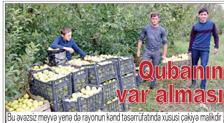
Bu əvəzsiz meyvə yene də rayonun kənd təsərrüfatında xüsusi çəkiyə malikdir.

Quba barədə danışanda almadan söz açmaq mümkün deyil. Rayonun kənd təsərrüfatında fındıq, qoz və digər məhsullar yetişdirilməsinə baxmayaraq, almanın xüsusi yeri var.