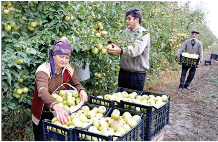
Əvvəli 1-ci sahə.

Bu əvəzsiz meyvə yemə də rayonun kənd təsərrüfatında xüsusi çəkiyə malikdir