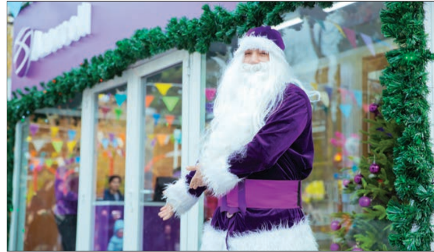
Xeyriyyə yarmarkası bu il öz konsepsiyasına görə əvvəlkilərdən daha fərqli və yaddaqalan olacaq. Fəvvarələr meydanında qurulmuş 47 evcik-

Yanvar ayının 6-dək davam edəcək bu xoşməramlı tədbirə fəaliyyəti boyunca gələcəyimiz olan uşaqların müdafiəsi, eləcə də onların hüquqlarının qorunması istiqamətində çoxsaylı layihələr həyata keçirən "Azercell Telekom" MMC də öz dəstəyini əsirgəməyib. Şirkət yarmarkada quraşdırılmış stendindən smartfon əldə edən müştəriləri hədiyyə ilə sevindirəcək. Belə ki, abunəçiləri öz istəklərinə uyğun olaraq 1000 şəbəkəxətti dəqiqə və ya 1 aylıq limitsiz internet əldə edə biləcəklər.