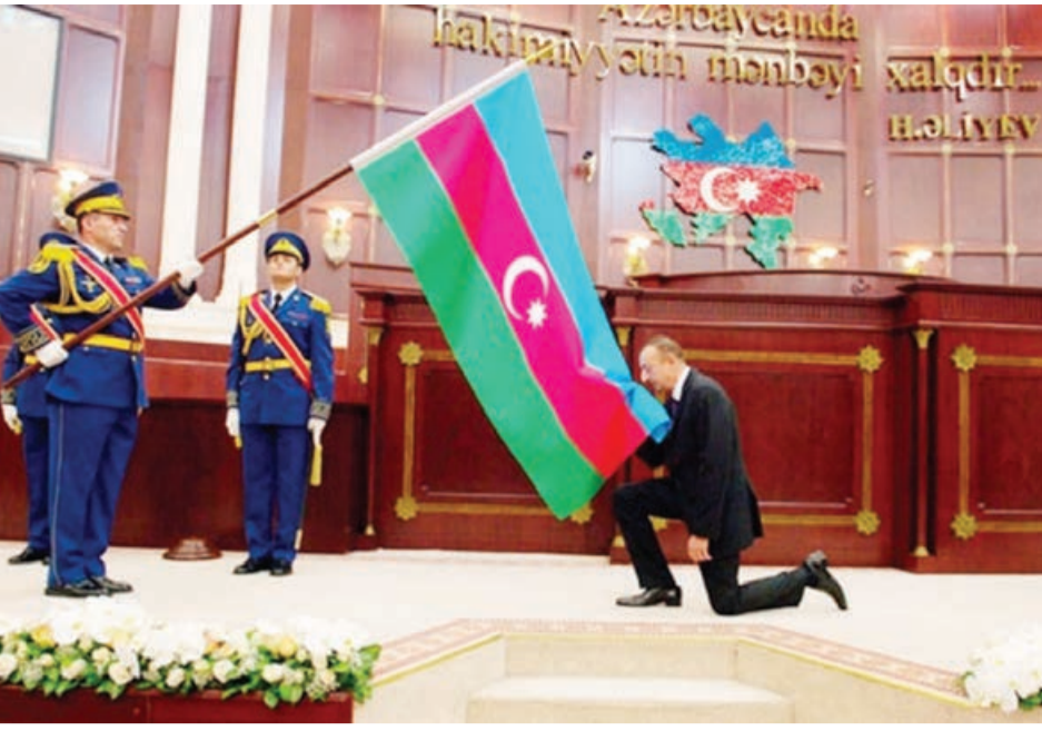
Anadan olmasının bu il 100 iliyini sonsuz ehtiram və minnətdarlıq hissi ilə qeyd etdiyimiz Ulu Öndər Heydər Əliyevin xalqımız və dövlətimiz qarşısında xidmətləri misilsizdir.