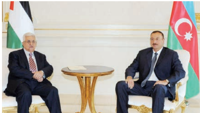
Fələstin Dövlətinin Prezidenti zati-alləri cənab Mahmud Abbasa

"Qardaş Fələstin xalqına sülh və amin-amanlıq diləyirəm"