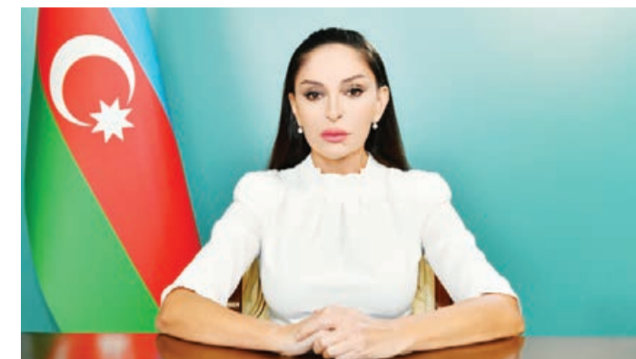
Birinci xanım Mehriban Əliyevanın "Fələstin üçün tək ürək" toplantısının iştirakçlarına müraciəti

"Ürək ağrısı ilə izlədiyimiz dözülməz insan iztirabları hər birimizi dərinəndən sarsıdır"