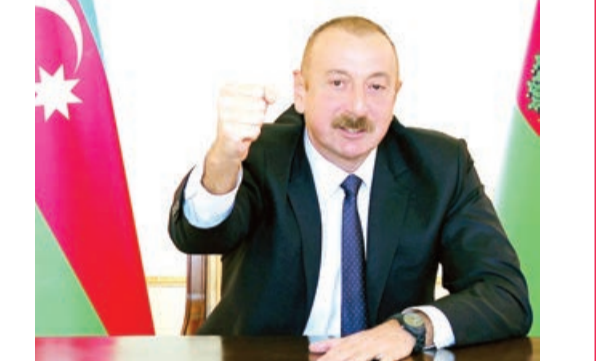
Öturməsən orada - İrəvanda, oradan boyanatlar verirsən, dünya liderlərinin zohləsinə tökürsən, adam qalmayıb ki, telefonla zəng etməyəsən".

Ali Baş Komandan Ermənistanın baş nazirinə də yeni ismarclarını göndərib: "Qarabağ Ermənistandır" deyən Ermənistanın baş naziri, nə oldu, indi demirsən "Qarabağ Ermənistandır". Gəl Füzuliyə, sən orada bizim torpağımızı istismar edirdin. Gəl Cəbrayıl, gəl Hadrut, gəl azad edilmiş başqa yerlərə, de ki, "Qarabağ Ermənistandır".