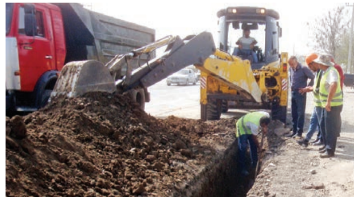
Seyran CAVADOV, "Azərbaycan"

bəsində və Arbatan kəndində su çəkilişi işləri aparılır. Bunun ardınca köhnə Ələt-Astara yolunun kənarında yaşayış məsivləri, Kürkənd kəndi əhalisi içməli su ilə təmin olunacaq. Mərhələli şəkildə həyata keçiriləcək layihəyə əsasən, Salyanın digər kəndlərinə də su çəkilecək. "Azərsu" ASC-nin məsul işçisi Rahat Salahovun dediklərinə əsasən, hazırda adıçəkilən rayonların mərkəzlərinə ekoloji cəhətdən təmiz çiməli su verilir. Dövlət başçısının 2021-ci ildə imzaladığı sərəncamla Salyanda bu işlər davam etdirilir. Layihə çərçivəsində indi rayon mərkəzindən kəndə yerləşən Plastmas yaşayış massivində, Dəmiryolu qəsə-