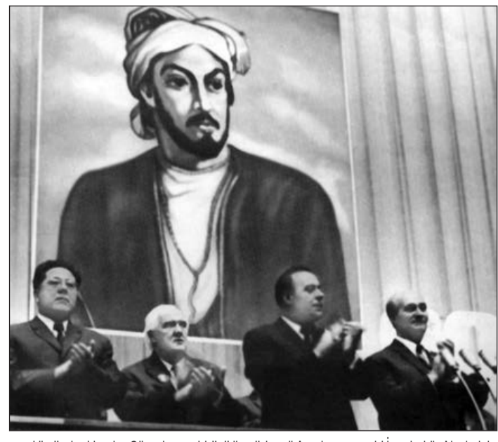
Ulu öndər Heydər Əliyevin təşəbbüsü ilə görkəmli Azərbaycan şairi İmadəddin Nəsiminin 600 illik yubileyi təntənəli şəkildə qeyd olunmuşdu. 13 sentyabr 1973-cü il

Seyid İmadəddin Nəsimi (1369-1417) görkəmli Azərbaycan şairi və mütəfəkkiridir. O, Azərbaycanın qədim elm və ədəbiyyat mərkəzlərindən biri olan Şamaxı şəhərində dünyaya gəlmişdir.