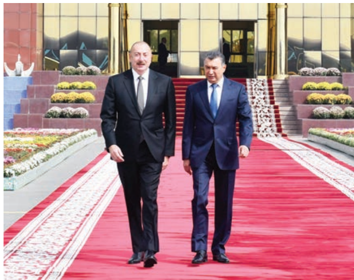
Azərbaycan Respublikasının Prezidenti İlham Əliyevin Tacikistan Respublikasına səfəri sentyabrın 15-də başa çatıb.

AZƏRTAC xəbər verir ki, Düşənbə Beynəlxalq Aeroportunda dövlətimizin başçısının səfərinə fəxri qarovul dəstəsi düzülüb. Azərbaycan Prezidenti İlham Əliyevi Tacikistandan Baş naziri Koxir Rasulzadə və digər rəsmi şəxslər yola saldılar.