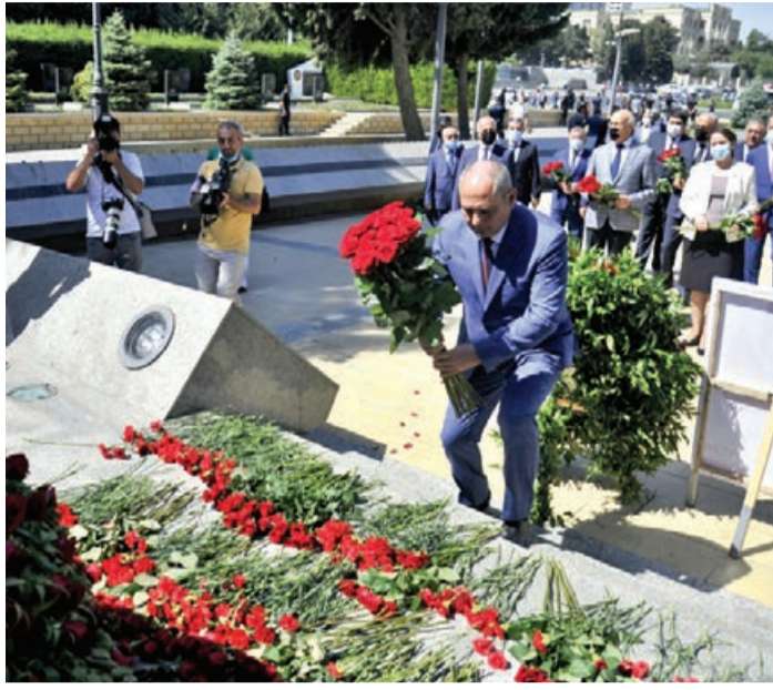
can "Türkiyə qardaşlığının abədi və sarsılmazlığını əks etdirən bu məzarlıqda uyan türk şəhidlərinin qəhr-

Siyasi partiya rəhbərləri və nümayəndələri Azərbaycanda "Türkiyə qardaşlığının abədi və sarsılmazlığını əks etdirən bu məzarlıqda uyan türk şəhidlərinin qəhr-