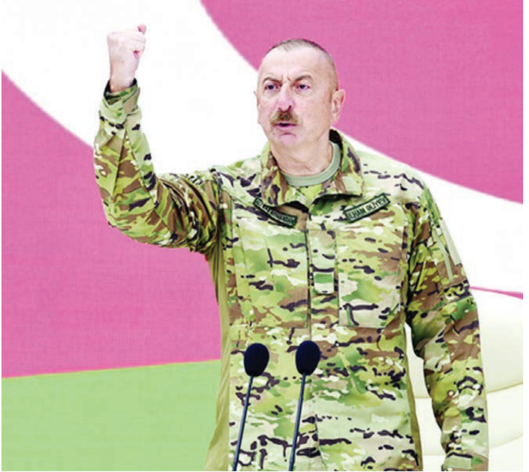
Əvvəli L-ci səh.

Əks təqdirdə ermənilər aqibətlərinin acınacaqlı olacağını yaxşı başa düşürlər