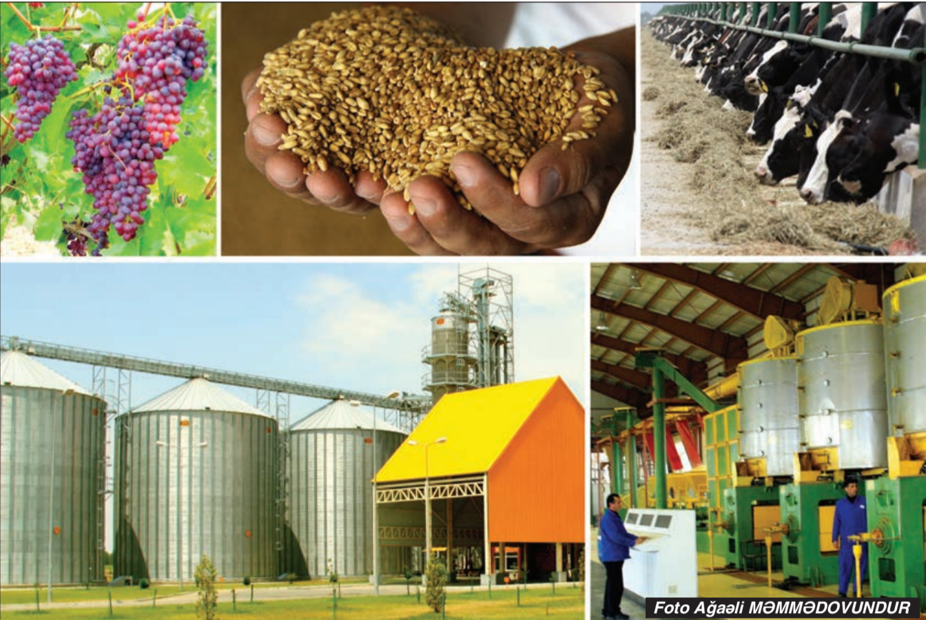
Əvvəli 1-ci səh.

Bu istiqamətdə atılan addımlar artıq real nəticələr verir və kənd təsərrüfatı uğurla inkişaf edir. Əsasən bitkiçilik sahəsində, heyvandarlıqda artım təxminən 50 faizə yaxındır. Hesab edirəm, bu sahəyə daha da böyük diqqət göstərilməlidir ki, heyvandarlıq da əhəmiyyətli dərəcədə artsın".