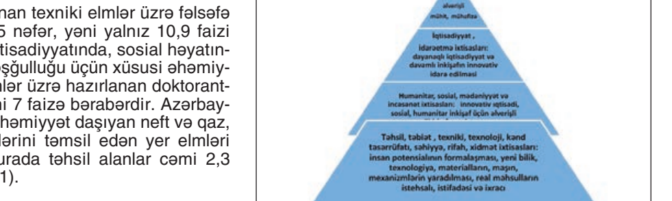
Şəkil 2. Təhsil müxtəlif səviyyəsində və müxtəlif ixtisaslar üzrə insan potensialının optimal formalaşdırılması

Hesabata 2020-ci ildə elm sahələrinə görə fəlsəfə doktoru proqramı üzrə təhsil alanların sayı təqdim olunub. Statistik hesabatdan eyni zamanda aydın olur ki, elmin hansı sahələri üzrə ixtisaslaşmış mütəxəssislər yaxın illərdə ölkənin intellektual əmək bazasında daxil olacaqlar və orada ən azı gələcək 25-30 ildə sayca üstünlük təşkil edəcəklər. Hesabata görə, hazırda doktoranturada sayca ən çox təhsil alanları iqtisadşünaslar təşkilatıdır: iqtisadiyyat və filologiya. 2020-ci ildə təhsil alan 2512 doktorantdan 424-ü iqtisad elmləri, 319-u isə filologiya elmləri sahəsində elmi çalışmaları həyata keçiriblər. Faiz göstəricisinə gəlincə aydın olur ki, gələcək fəlsəfə doktorlarının 16,9 faizi iqtisadçı, 12,7 faizi isə filoloq olacaq. Mütəxəssis üçün qeyd ediləndir ki, ölkədə sənayenin bütün sahələrinin elmi