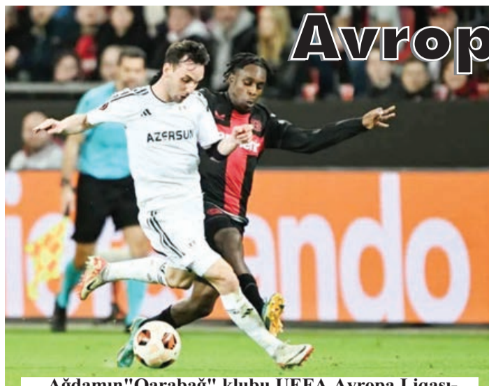
Ağdamın "Qarabağ" klubu UEFA Avropa Liqasının 1/8 final mərhələsinin cavab qarşılaşmasında Almaniya "Bayer 04" (Leverkuzen) qonağı oldu. Bu matçdan bir həftə öncə Bakıda 2:2 hesabı ilə başa çatan oyunun revanşında meydan sahibləri son dəqiqələrdə vurduqları qollarla 3:2 hesabı ilə qələbə qazandılar.