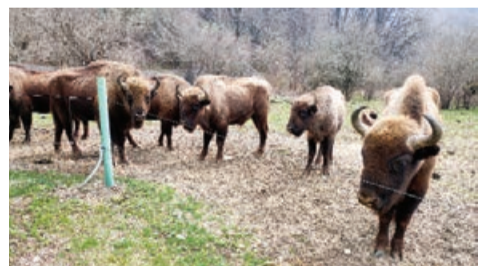
Xatırladaq ki, zublarnın vaxtilə Avrsiyada çox geniş arealda yayılmaqla, ötən əsrin əvvəllərində vəhşi təbiətdə nəslilə kəsilib. Qafqaz dağlarında sonuncu zubr 1927-ci ildə öldürülüb. Hazırda dünyada mövcud olan zublarnın böyük əksəriyyəti zooparklarda artırılıb və bu yolla növün bərpasına yönəlməmiş sayılır davam edir. Zublarnın Azərbaycanda biomüxtəlifliyin daha da zənginləşdirilməsi və meşə ekosistemlərinin inkişafında potensial rolunu nəzərə alaraq, layihənin təşkilatçıları Azərbaycanın şimal bölgələrində yaşayan əhalini və ümumiyyətlə, ölkə ictimaiyyətini Qafqaz zublarnın təbii mühafizəsinin, onların mühafizəsi və qanunsuz ovlanmasının qarşısını alınması istiqamətində dəstək olmağa çağırırlar.

IDEA İctimai Birliyi, Ekologiya və Təbii Sərvətlər Nazirliyi və Ümumdünya Təbii Mühafizə Fondunun (WWF) Azərbaycan nümayəndəliyi tərəfindən həyata keçirilən zublarnın reintroduksiya layihəsi çərçivəsində 27 baş zubr vəhşi təbiətə buraxılıb. Bununla da Avropadan ölkəmizə gətirilən Şahdağ Milli Parkının İsmayılı bölməsinin ərazisində buraxılan zublarnın sayı 41 başa çatıb.