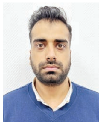
münasibətlər qurulması və onların xarici ölkənin xüsusi xidmət orqanı tərəfindən məxfi əməkdaşlığa cəlb edilməsi istiqamətində fəaliyyət göstərdiyi məlum olub.