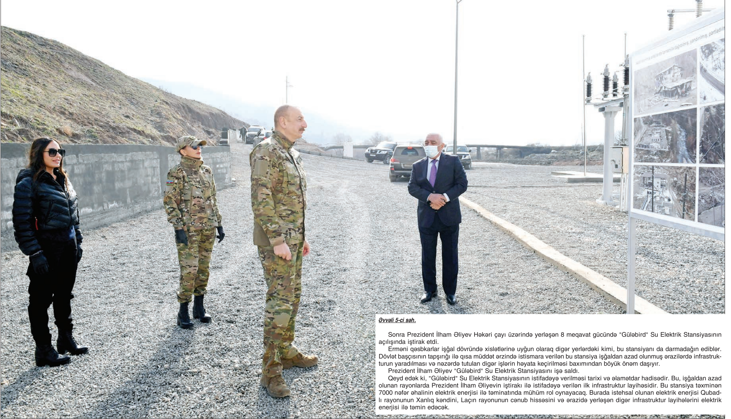
Əvvəl 5-ci səh.

Sonra Prezident İlham Əliyev Həkəri çayı üzərində yerləşən 8 meqavat gücündə "Gülebırd" Su Elektrik Stansiyasının açılışında iştirak etdi.