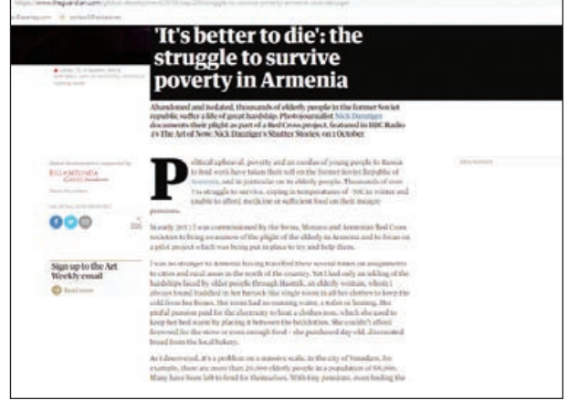
It's better to die: the struggle to survive poverty in Armenia

Böyük Britaniyanın "The Guardian" qəzetində Ermənistandakı aclıq və səfalətə bağlı Nik Denziger Din adlı fotomüxbirin "Ölsəm daha yaxşıdır: Ermənistanda qocaların ifrat ağır sosial vəziyyəti" serilövhlə məqaləsi dərc olunub. AZƏRTAC xəbər verir ki, məqalədə qeyd edilir ki, Ermənistanda baş verən siyasi çevriliş, geniş yayılmış yoxsulluq və səfalət, eləcə də gənclərin iş tapmaq məqsədilə Rusiyaya böyük axını ölkədə xüsusilə də yaşlı insanların acınarlı vəziyyətə düşməsinə gətirib çıxarıb. Yaşı 75-dən yuxarı olan minlərlə insan qışda mənfi 30 dərəcə temperatur şəraitində həyat mübarizəsi aparır və verilən çox cüzi təqaüd isə onların yetərincə qidalanmaları və ya