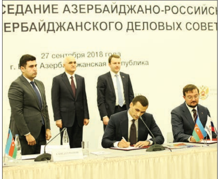
Əvvəlki 1-ci səh.

İlham Əliyevlə Vladimir Putin arasındakı səmimi dostluq möhkəm bazaya əsaslanıb münasibətlərə dinamizm verir