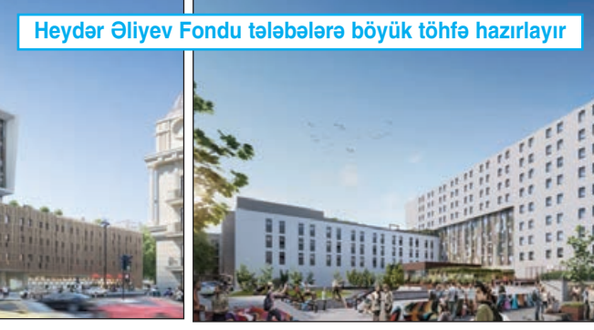
Heydər Əliyev Fondu tələbələrə böyük töhfə hazırlayır

saylı yataqxanamızda 157 nəfər qız tələbəmiz yerləşib. Oğlanlar üçün 2 yataqxanamız var və onlarda təqribən 400-ə yaxın tələbə yerləşdirmək mümkündür. 273 nəfərlik 5 saylı yataqxana isə əcnəbi tələbələr üçündür. Hər il tələbələr müqavilə bağlayır. Bu il də gözlənilir ki, təqribən 800-850 nəfər tələbə yataqxana ilə təmin olunsun. Bizim yerli