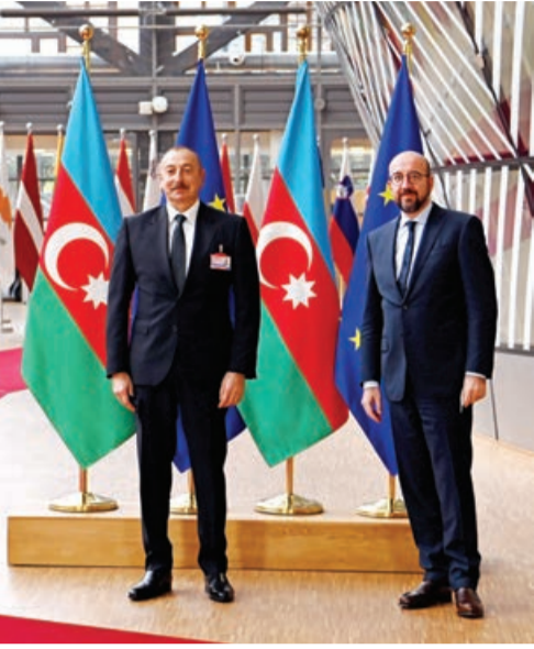
Dekabrın 14-də Brüsseldə işgüzar səfərdə olan Azərbaycan Respublikasının Prezidenti İlham Əliyev ilə Avropa İttifaqı Şurasının Prezidenti Şarl Mişel arasında görüş olub.

AZƏRTAC xəbər verir ki, Avropa İttifaqı Şurasının Prezidenti Şarl Mişel dövlətimizin başçısı İlham Əliyevi qarşıladı. Sonra birgə foto çəkdirildi.