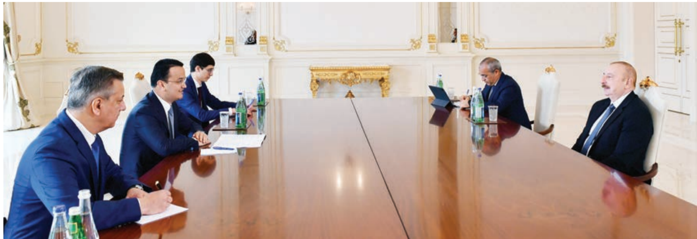
Əvvəli 1-ci sah.

Dövlətimizin başçısı Lazım Kudratovun ölkəmizə səfəri zamanı qarşıdakı illərdə əməkdaşlığın gündəliyi və qarşıya qoyulan məqsədlərə nail olunması ilə bağlı səmərəli müzakirələrin aparılacağına əminliyini bildirdi.