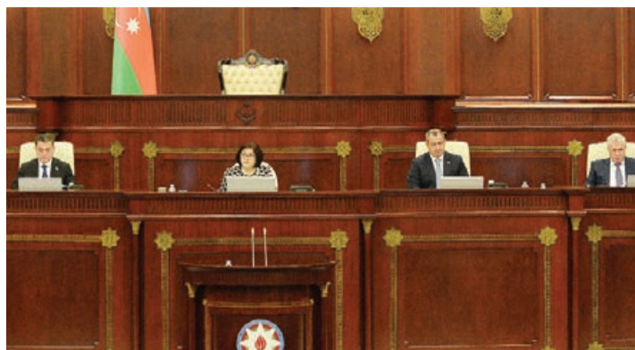
Əvvəli 1-ci sah.

Onlar büdcə siyasətində iqtisadiyyatın, onun qeyri-neft sektoru, kənd təsərrüfatı kimi sahələrinin inkişafının dəstəklənməsi, əhalinin həssas qruplarının, xüsusən də şəhid ailələrinin və müharibə iştirakçıların, hərbi qulluqçuların sosial müdafiəsinin gücləndirilməsi tədbirlərini yüksək qiymətləndiriblər.