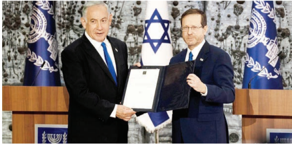
liberal Baş nazir Yair Lapidin kabinetini əvəz edəcək

Yeni hökumət sabit və məsuliyyətli olacaq