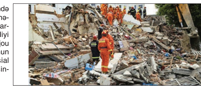
Bildirilir ki, bina çökən zaman mehmanxanada 23 nəfər olub. Hadisə nəticəsində 17 nəfər ölüb, 5 nəfər yaralanıb, 1 nəfər isə xəsarət almayıb.

Çinin Tszyansu əyalətində mehmanxana binasının çökməsi nəticəsində ölənlərin sayı artıb. TASS agentliyinin verdiyi xəbərə görə, bu barədə Suçocu şəhərinin Utszyan rayonunun rəhbərliyinin "WeChat" sosial şəbəkəsindəki rəsmi sahifəsində məlumat verilir.