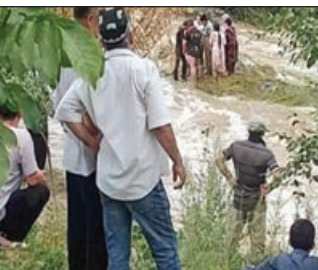
Özbekestan Fövqəladə Hallar Nazirliyinin Mətbuat xidmətindən bildirilib ki, Qırğızıstanın Cəlal-Abad bölgəsində yağın güclü yağışları səbəbindən Namanqan vilayətində Kasansay çayı daşdı.

Ərazidə axtarış və xilasətmə işləri davam edir.