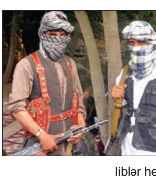
Ötən ayın 16-da baş vermiş hadisənin bir neçə videoyazısı telekanalın əlinə keçmişdir.

Qeyd edək ki, Kubada iyulun 11-dən hökumətə qarşı etiraz aksiyaları başlayıb.