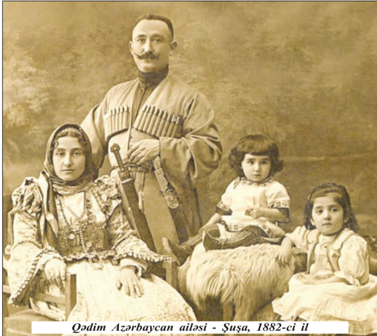
Qədim Azərbaycan ailəsi - Şuşa, 1882-ci il