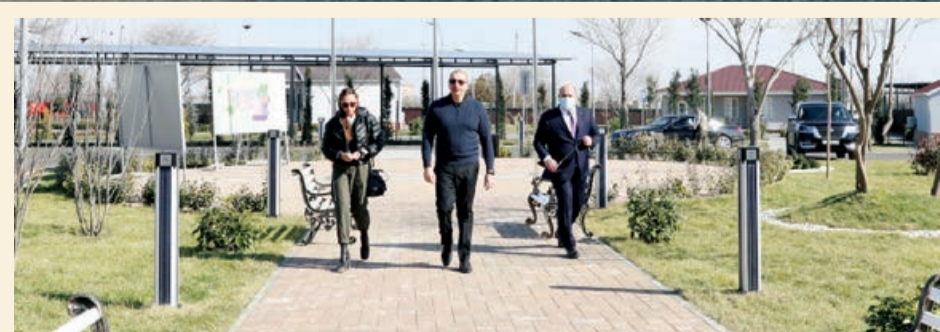
Xüsusi nümayəndəliyin qərargahında yaradılan şəraitlə tanışlıq