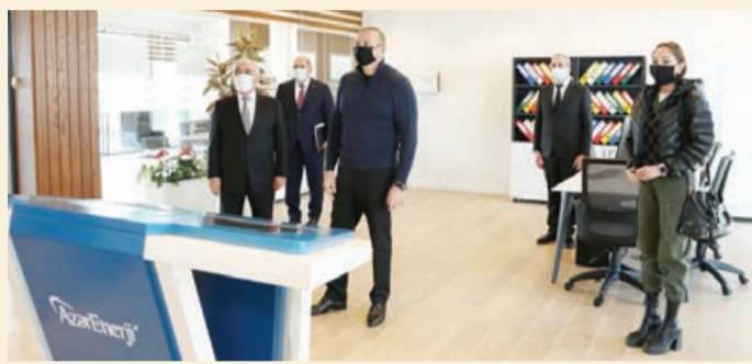
"Qarabağ" Regional Elektrik Şəbəkəsinin Rəqəmsal İdarəetmə Mərkəzinin açılışı olub

Prezident İlham Əliyev və birinci xanım Mehriban Əliyeva Ağdam və Ağcabədi rayonlarına səfər ediblər