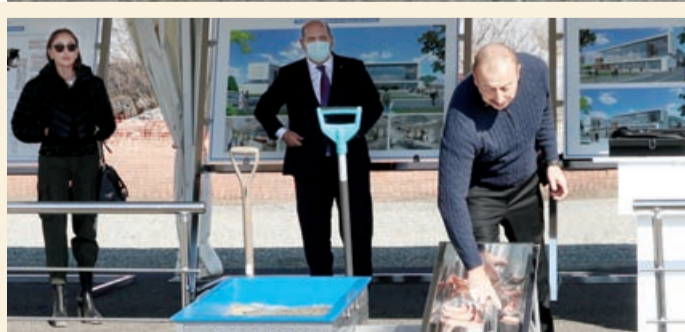
210 çarpayılıq Ağdam Rayon Mərkəzi Xəstəxanasının təməli qoyulub