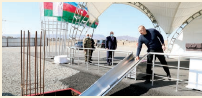
"Park Forest Hotel Ağdam" mehmanxanasının təməli qoyulub