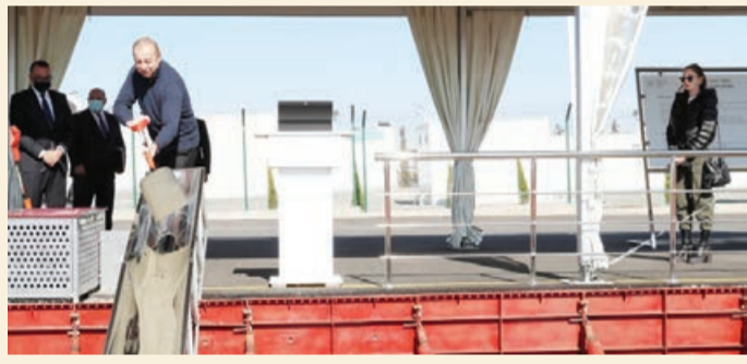
Ağdam Sənaye Parkında iki müəssisənin təməli qoyulub