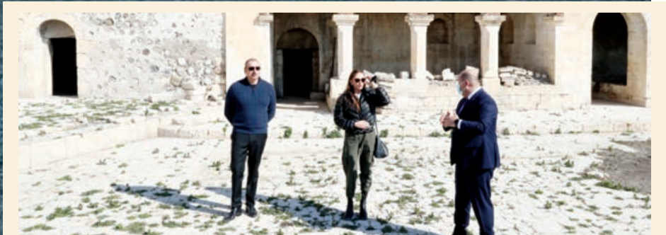
Qarabağ xanlarının türbələri və yaşayış evi - İmarət kompleksi ilə tanışlıq