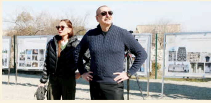
Ağdam Cümə məscidində bərpa-restavrasiya işləri ilə tanışlıq