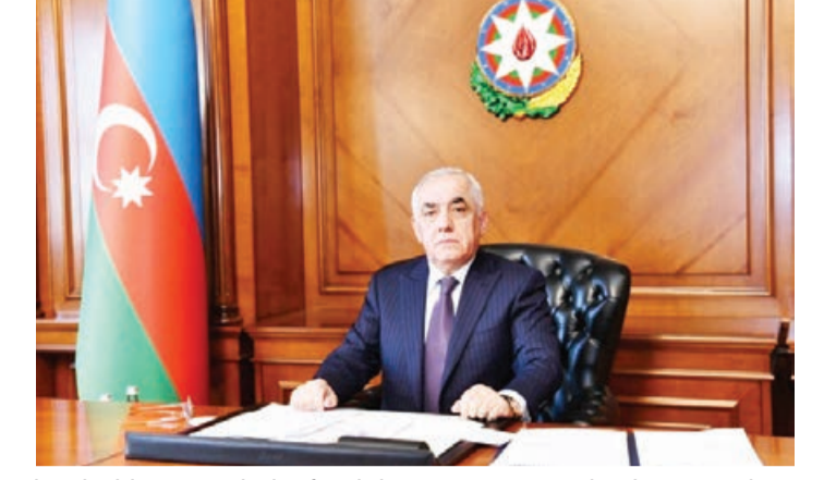
ləndirilib, qarşılıqlı faydalı məsləhətlər müzakirə olunub.

Nazirlər Kabinetinin Mətbuat xidmətindən AZƏRTAC-a bildirilib ki, telefon danışığı zamanı Gürcüstanda baş vermiş zəlzələ ilə bağlı narahatlıq və həmrəylik ifadə edilib. Eyni zamanda Azərbaycan-Gürcüstan dostluq münasibətlərinin müxtəlif sahələrdə inkişafı yüksək qiymət