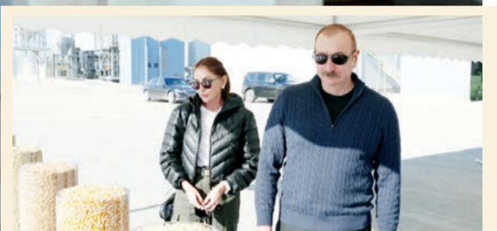
"Ağcabədi Təxil Aqropark"da yaradılan şəraitlə tanışlıq