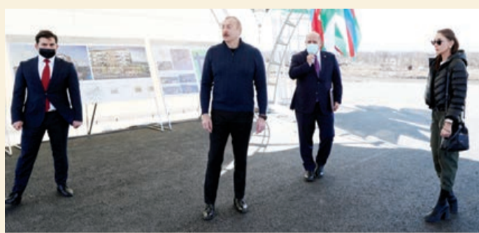
209 mənzildən ibarət yeni yaşayış kompleksinin təməli qoyulub