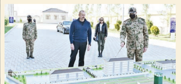
Daxili İşlər Nazirliyi Daxili Qoşunlarının yeni inşa olunan hərbi şəhərciyinin açılışı olub