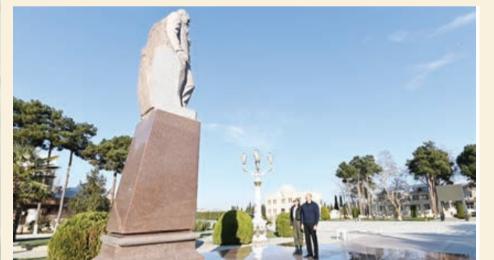
Ümummilli Lider Heydər Əliyevin abidəsini ziyarət