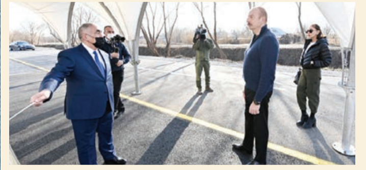
Avşar-Salmanbəyli-Aşağı Avşar-Xocavənd avtomobil yolunun açılışı olub