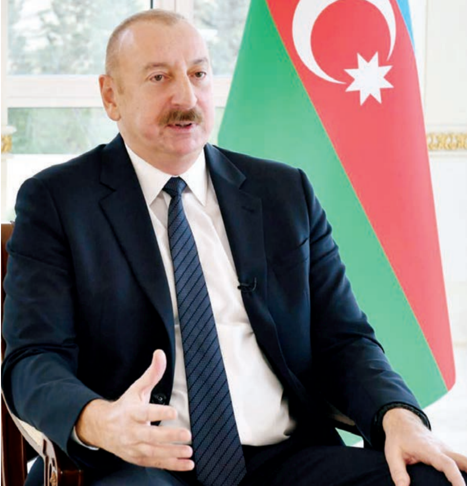
Azərbaycan Prezidenti İlham Əliyevin bütün müsahibə və çıxışları bir qayda olaraq həmişə istər yerli, istərsə də dünya KİV-ində böyük rezonans doğurur.

Dövlət başçısının "Euronews" televiziyasına verdiyi son müsahibə də siyasi şərhçilər tərəfindən həm ölkə, həm də dünya mətbuatında geniş müzakirə olunur.