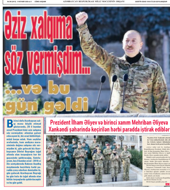
Prezident İlham Əliyev və birinci xanım Mehriban Əliyeva Xankəndi şəhərində keçirilən hərbi paradada iştirak edirlər.