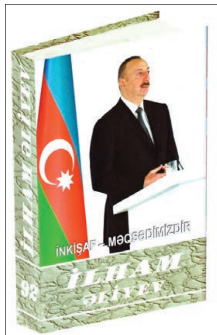
"Azərbaycan sabitlik, təhlükəsizlik məkandır. Yaxın tarix əyani şəkildə göstərdi ki, sabitlik pozulanda ölkələr idarəolunmaz vəziyyətə düşür, iqtisadiyyat çökür, sənaye iflic olur, insanlar əziyyət çəkir və sonra bu vəziyyətdən çıxmaq üçün onilliklər lazım olur. Azərbaycan uğurlu inkişaf modelinin əsas qayəsi ondadır ki, ölkəmizdə aparılan siyasət xalq tərəfindən dəstəklənir. Çünki bu siyasət xalqımızın rifah halının yaxşılaşmasına hesablanır. Bu siyasət ölkəmizin güclü dövlətə çevrilməsinə hesablanır. Məhz bu siyasət nəticəsində bu gün Azərbaycan dünyanın müxtəlif kürsələrindən öz sözünü açıq deyir, öz müstəqil siyasətini aparır, öz maraqlarını tam şəkildə qoruyur."

AZƏRTAC xəbər verir ki, "İlham Əliyev. İnkişaf - məqsədimizdir" çoxillidliyinin yenicə çapdan çıxmış 92-ci kitabında yer alan bu fikirləri dövlət başçısı "Azərbaycan Respublikası regionlarının 2014-2018-ci illərdə sosial-iqtisadi inkişafı Dövlət Proqramı"nın icrasının yekunlarına həsr olunmuş konfransdakı nitqində söyləyib.