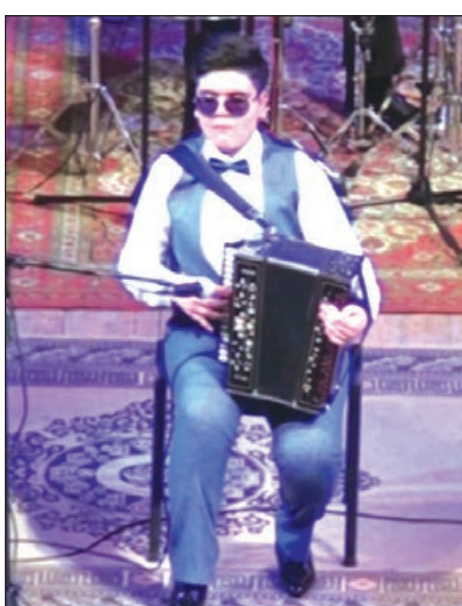
Əmək və Əhalinin Sosial Müdafiəsi, istərsə də Gənclər və İdman nazirliklərinin keçirdiyi festivallarda bizim uşaqlar uğurla çıxış edirlər, laureat, diplomant olurlar. Bundan əlavə, hər il Mədəniyyət Nazirliyinin dəstəyi ilə şagirdlərimiz 23 aprel Uşaq bayramında və Moskva “Belaya trost” müsabiqəsində uğurla çıxış edirlər”.