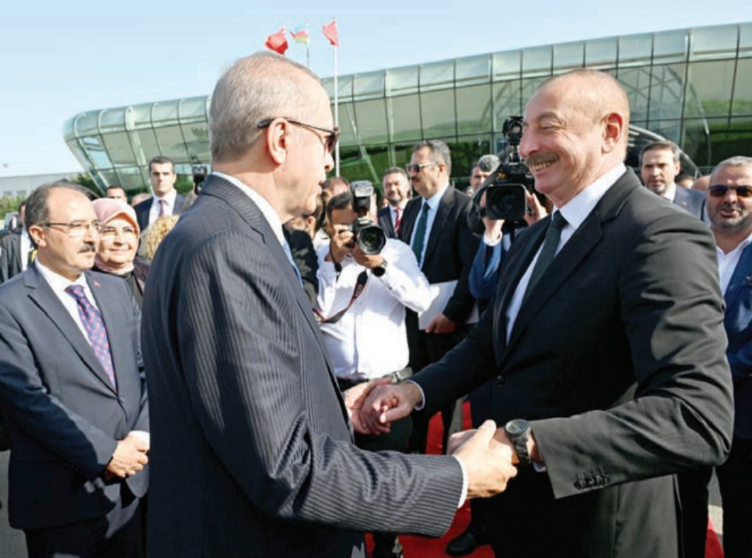
Türkiyə Respublikasının Prezidenti Rəcəb Tayyib Ərdoğanın Azərbaycan Respublikasına dövlət səfəri iyunun 13-də başa çatıb.

AZƏRTAC xəbər verir ki, Azərbaycan Respublikasının Prezidenti İlham Əliyev və Türkiyə Respublikasının Prezidenti Rəcəb Tayyib Ərdoğanın Azərbaycan Respublikasına dövlət səfəri iyunun 13-də başa çatıb.