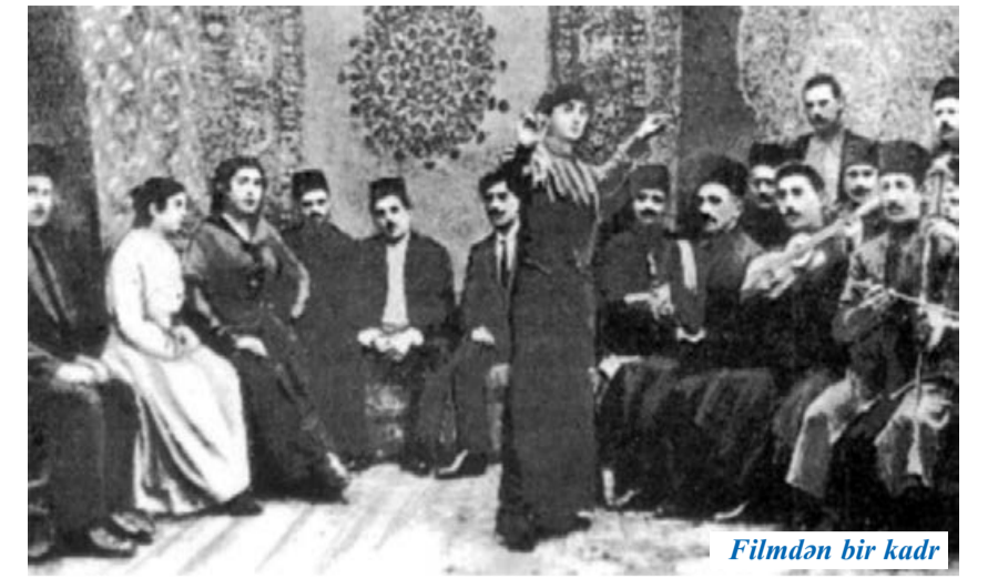
Filməndən bir kadr

"Neft və milyonlar səltnətində" filmi Azərbaycan kino tarixində ilk tammətrajlı bədii filmi olması kimi mühim statusu ilə yanaşı, əsas rollardan birini (Lütfəli bəy rolunu) görkəmli teatr və kino xadimi Hüseyn Ərəblinskinin öz əməsi baxımından da əhə-