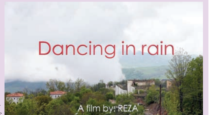
Dancing in rain

Paylaşımında deyilir: "30 il əvvəl Qarabağdakı müharibə haqqında beynəlxalq mediaya reportaj hazırlamaq üçün Parisdən bura gəlmişdim. Şəhər erməni silahlı qüvvələrinin mühasirəsində idi və mülki vətəndaşlar raket və artilleriya hücumuna məruz qalırdılar. 1992-ci il mayın 8-də şəhərin işğalından sonra