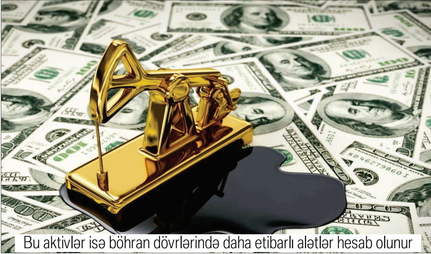
Bu aktivlər isə böhran dövrlərində daha etibarlı alətlər hesab olunur

Bu vəziyyətin ARDNF-nin investisiya portfelinə nə dərəcədə təsir edəcəyi sualına isə fondun belə cavab verilməmişdir: "Fondun büdcə proqnozları illik əsasda təsdiq edilir