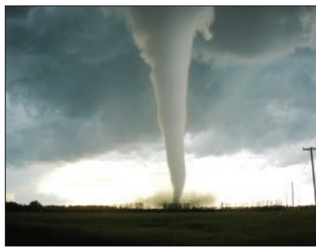
Tornado Missisipi ştatında

arta biləcəyi istisna olunmur. “NBC News” telekanalının xəbərinə görə, tornado ABŞ-in digər cənub ştatlarından keçərək Luiziana və Texasın bəzi rayonlarında yaşayış binalarına və digər tikililərə ziyan vurmuşdur. Missisipi və Luizianada 45 min nəfərdən çox adam işsiz qalmışdır.