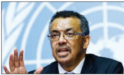
ÜST-ün rəhbəri Tedros Adhanom Gebreyesus

Qeyd edək ki, Türkiyə koronavirusla mübarizə aparmaq üçün dünyanın bir sıra ölkələrini, o cümlədən İtaliya, İspaniya, Böyük Britaniya, Serbiya və Bosniyanı tibbi ləvazimatla təchiz etmişdir.