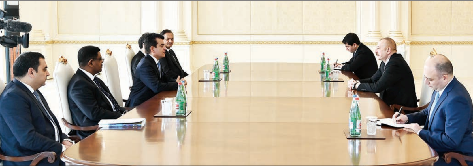
Əvvəli 1-ci sah.

44 günlük müharibə regionda vəziyyəti dəyişdi. Dediym kimi, müharibə bitib, biz növbəti sahifəyə keçməliyik. Biz ağrını, yaraları heç vaxt unutmayacağıq. Yaralar heç vaxt sağalmayacaqdır. Biz qəhrəmanlarımızı heç vaxt unutmayacağıq. Lakin, eyni zamanda, biz gələcəyə baxmalıyıq və əraziləri, tam viran qalmış ərazini yenidən qurmalyıq və biz bunu edəcəyik, artıq bu işlərə başlanılıb. İnfrastruktur layihələri, şəhər planlaşdırılması və yenidənqurma işləri çox digər mühüm elementləri artıq icra olunmaqdadır. Bu il biz bu işlər üçün əsaslı vəsait ayırmışıq.