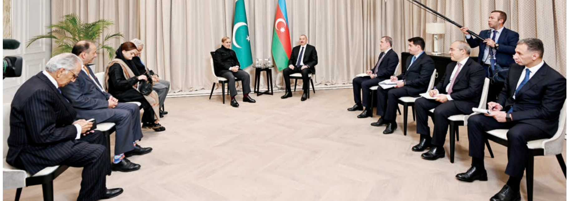
Oktyabrın 12-də Qazaxıstana işgüzar səfərə gələn Azərbaycan Respublikasının Prezidenti İlham Əliyevin Astanada Pakistan İslam Respublikasının Baş naziri Şahbaz Şəriflə görüşü olub.

AZƏRTAC xəbər verir ki, Prezident İlham Əliyev Səmərqənddəki görüşdən bir ay sonra Astanada keçirilən bu görüşün ölkələrimiz arasında əlaqələrin dinamikliyini bir daha göstərdiyini bildirdi. Dövlətimizin başçısı ilə Səmərqənddəki görüşünün məmnunluqla xatırladığından Baş nazir Şahbaz Şərif Prezident