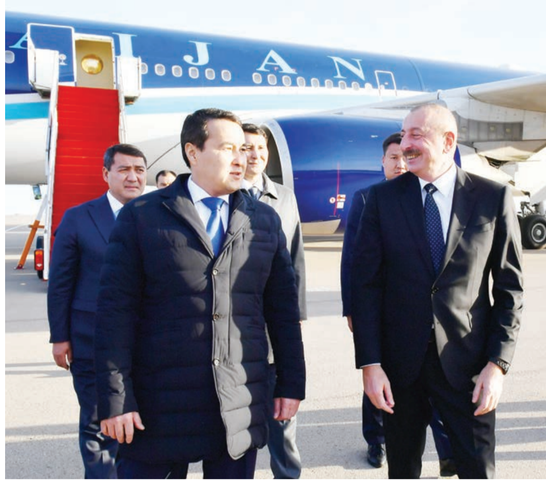
Azərbaycan Respublikasının Prezidenti İlham Əliyev Asiyada Qarşılıqlı Fəaliyyət və Ehtimad Tədbirləri üzrə Müşavirənin 6-cı Zirvə Toplantısında və MDB Dövlət Başçılarının iclasında iştirak etmək üçün oktyabrın 12-də Qazaxıstan Respublikasına işgüzar səfər edib.

AZƏRTAC xəbər verir ki, hər iki ölkənin Dövlət bayraqlarının dalğalandığı Nursultan Nazarbayev adına Beynəlxalq Hava Limanında dövlətimizin başçısını Qazaxıstanın Baş naziri Əlihan Smailov və digər rəsmi şəxslər qarşıladılar.